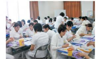
基礎看護技術(採血)