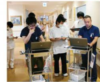
脊髄脊髄外科 早朝カンファレンス