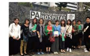
オーストラリア研修