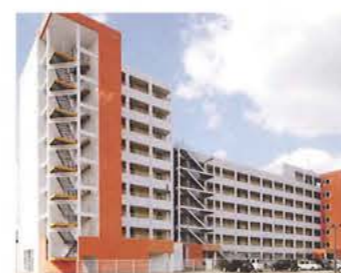
病院に隣接する寄宿舎「メゾンドすみれ」

屋上からは関門海峡を往来する船を眺めることができ、夏の花火大会も楽しめます。また10分程度(JR)で門司港レトロの街も散歩できます。さらに、夜間照明を完備したテニスコート(フットサルコート)も整備されており、職員にも開放しています。室内は10畳のフローリングに備え付けの大容量クローゼットで収納も安心。オール電化でとても快適に生活ができます。職員からも、とても人気があります。