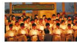
クリスマス演奏会