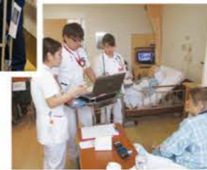
KYT(危険・予知・トレーニング)