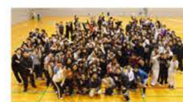
院内バレーボール大会