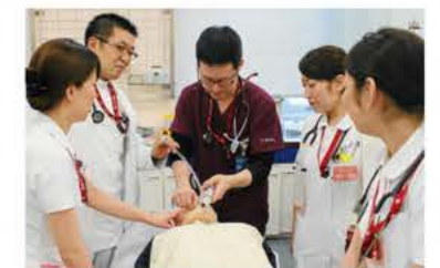
ER研修(研修医と共に)