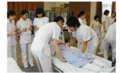
基礎看護技術演習中