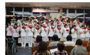
12月 院内クリスマス会