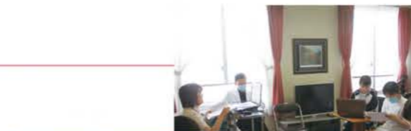
脳神経外科カンファレンス

楽しかったです。正直、最初は自分のできなさに落ち込むことがありました。しかし、先輩看護師さんが「そんなに焦らなくて大丈夫」と言って話を聞いて下さり気持ちが楽になりました。(新人看護師)