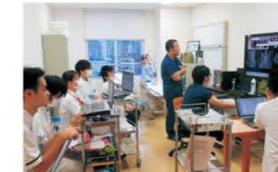
脊髄脊髄外科勉強会