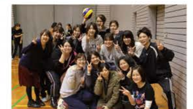
3月 病棟対抗バレーボール大会