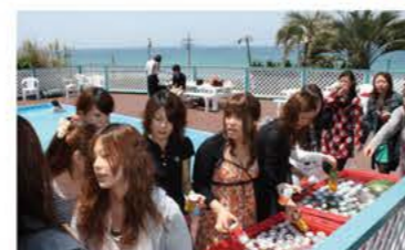
5月 院内プール開き