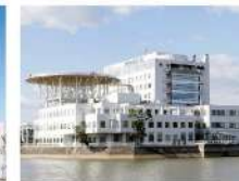
新行橋病院 福岡県行橋市・246床