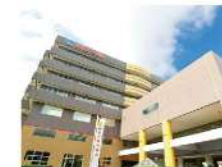
東京品川病院 東京都品川区・296床