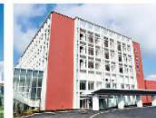
新久喜総合病院 埼玉県久喜市・320床