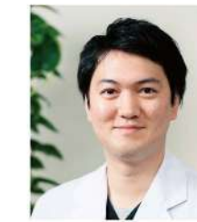
呼吸器外科 (久留米大 H27年卒)