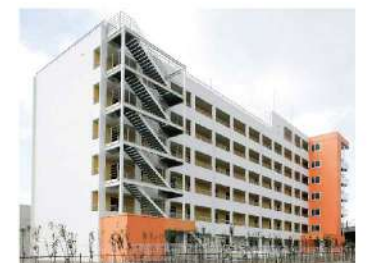
研修医・看護師宿舍