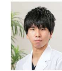
循環器内科 (島根大 R3年卒)