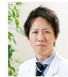
脊椎脊椎外科 (宮崎大 H23年卒)