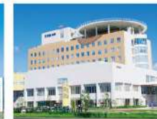
新武雄病院 佐賀県武雄市195床