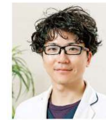
内科 (長崎大 H23年卒)