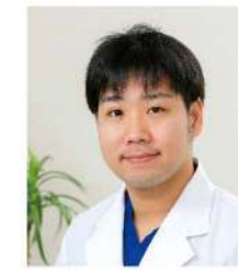
脊椎脊椎外科 (琉球大 H31年卒)