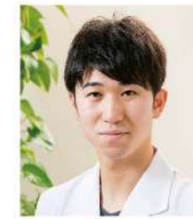
整形外科 (島根大 H30年卒)