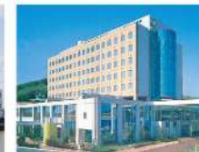
福岡新水巻病院 福岡県遠賀郡・227床