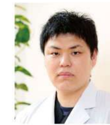
整形外科 (琉球大 H25年卒)