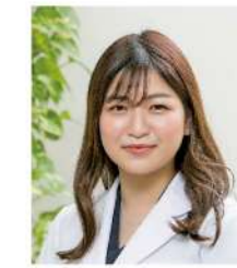
呼吸器外科 (大分大 R2年卒)