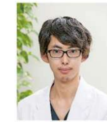
外科 (宮崎大 H31年卒)