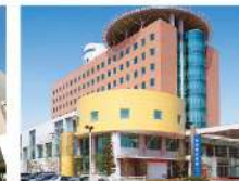
福岡和白病院 福岡市東区・369床