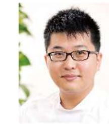
内科 (島根大 H28年卒)