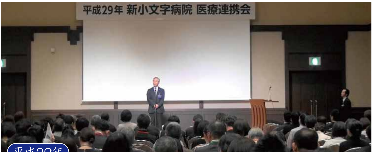
平成29年 新小文字病院 医療連携会

新小文字病院は地域の医療機関や介護施設、そして地域の皆様から信頼され、必要とされる病院を目指し、これからも職員丸となって努めてまいりますので、よろしくお願いたします。