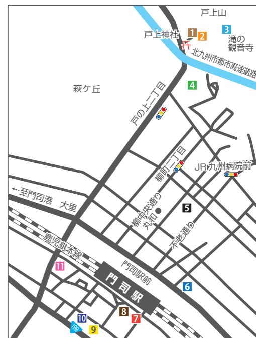
▲ Access map