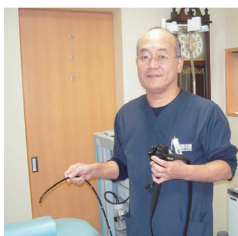
経鼻内視鏡による検査を行っています。