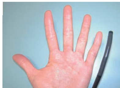
この大きさのものが鼻から入ります。