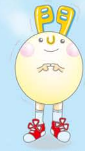
新小文字病院 広報部 マスコットキャラクター

一万人を超えるそうです。踊りも審査されており、グランプリ・優秀賞・ハッスル賞・スマイル賞・ユーモア賞の5つの表彰があります。一昨年、新小文字病院は「ユーモア賞」を受賞させて頂きました。 新小文字病院からは職員やその家族、福岡水巻看護助産学校の皆さんにも参加して頂き100名を超える参加者と共に参加しました。 私たちは、ろくに踊りの練習をしていませんでした。加えて決して上手でもありませんでした。しかし…今年度は「スマイル賞」を受賞させて頂きました。