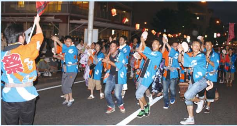
わっしょい百万夏まつりパレード参加