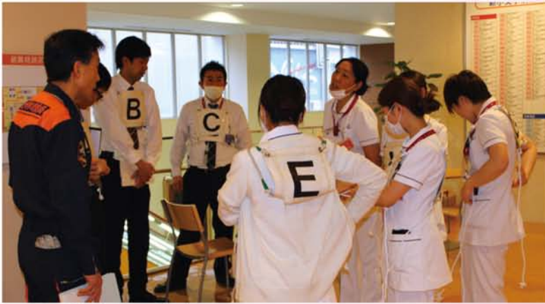
救助・誘導のミーティングの様子