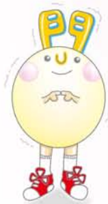
新小文字病院啓発雑誌 マスコットキャラクター

この度は貴重な訓練を頂き 有難うございました。 私達はいつ起こるかもしれな い災害というものを通して、 もう一度、新小文字病院の防災 対策を見直して行きたいと思 います。