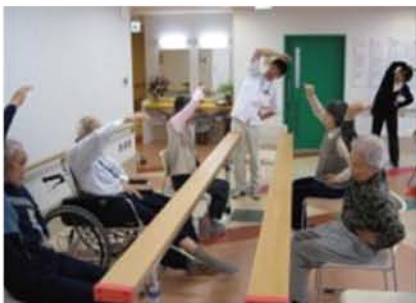
▲ みんなで体操に取り組む光景

「デイサービスセンター」というのはお好きな日に送迎車でお越しいただき、主に食事、入浴、レクリエーション等を楽しみながら1日を過ごして頂く場です。 シスターではこれに加え「少しでも長く元気で暮らしたい」との想いから「元気な体を維持すること」を目的としたリハビリテーションを全施設で行っています。