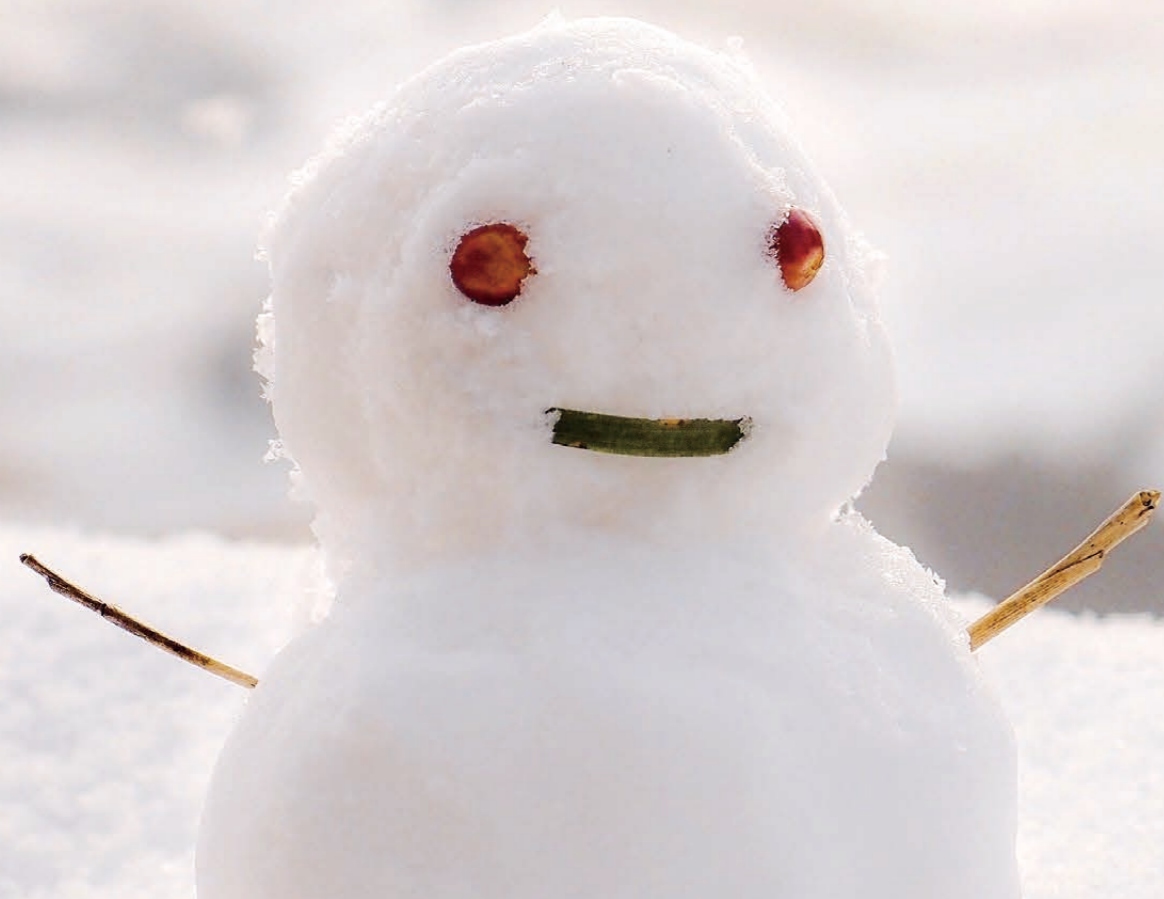
「平尾台の雪だるま」